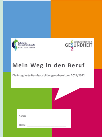
Aktuelles Kommunikationsheft und der daraus entstandene IBA-Wegweiser