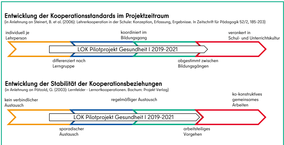
Entwicklung der Kooperationsstandards und -beziehungen.

Zudem führte die WB im Juli und im Dezember 2020 am OSZ Gesundheit I Einzelfallanalysen zur näheren Bestimmung der Gelingensbedingungen der Lernortkooperation durch. Diese basieren auf Dokumentenanalysen und Gesprächen. In der nachfolgenden Auswertung wurden wissenschaftlich-evaluativ erhobene Befunde mit reflektierten Wahrnehmungen und Erfahrungen der handelnden Akteure in den betroffenen Handlungsfeldern kombiniert.